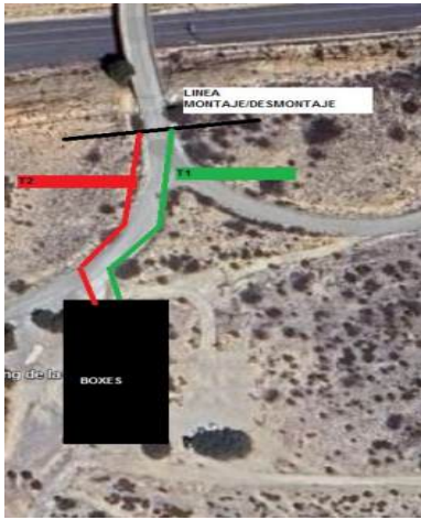
línea de desmontaje