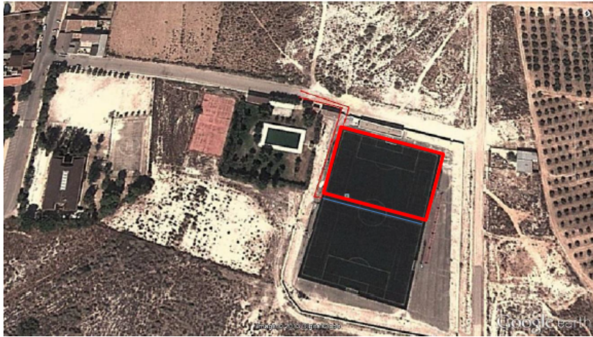
Recorrido de carrera a pie 400m